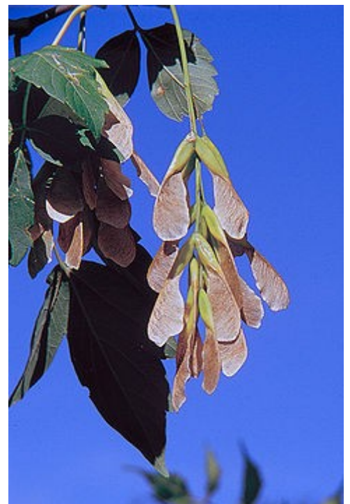
Frutos. Las alas asimétricas (rosadas con un tinte morado en la imagen) de cada fruto ayudan a su dispersión con el viento lejos del árbol.